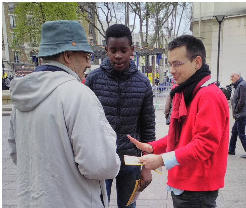
Un jeune de 4ème (13 ans) avec son animateur...